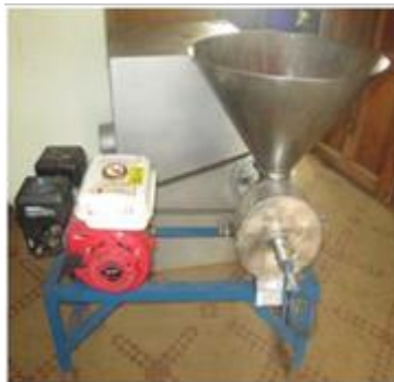
Figure 1 : Moulin à meules